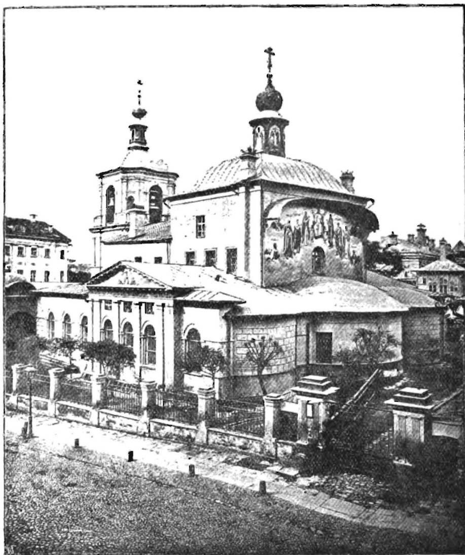
Настоящій фасадъ Московской Георгіевской, что на Красной горкѣ, церкви.