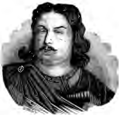
КНЯЗЬ ЯКОВЪ ФЕДОРОВИЧЪ ДОЛГОРУКОЙ.