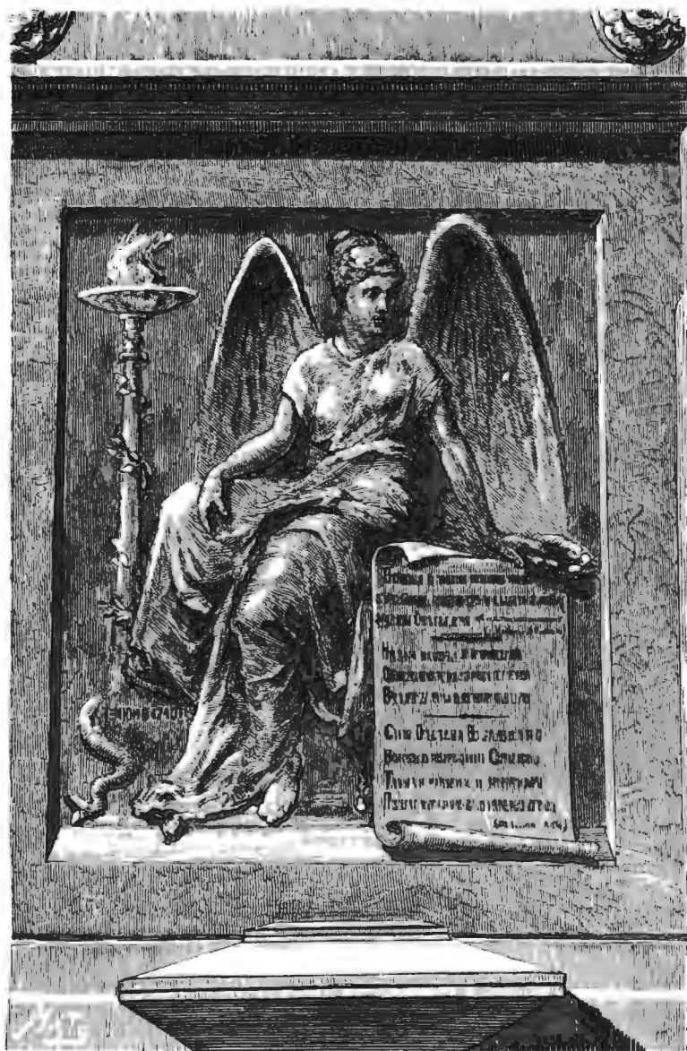
БАРЕЛЬЕФЪ НА ПАМЯТНИКѢ ВОЛЫНСКАГО, ЕРОПКИНА И ХРУЩОВА, СООРУЖЕНЪ ВЪ 1885 Г.