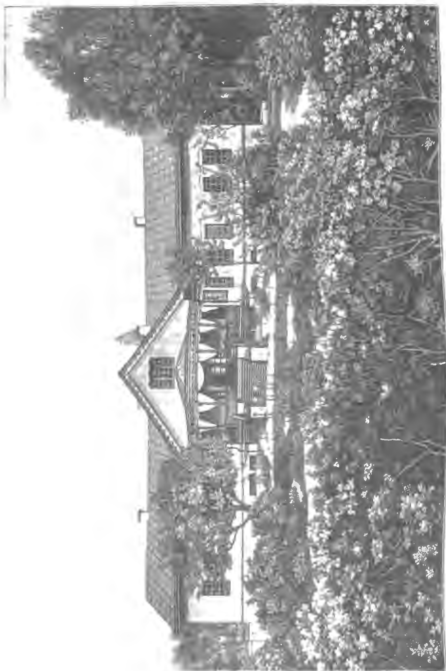
Дача въ которомъ жилъ и скончался НИКОЛАЙ ИВАНОВИЧЪ ПИРГОВЪ